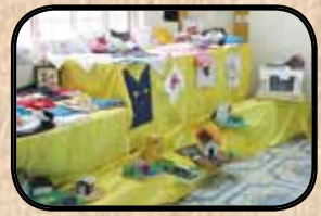
ارائه مؤثر در جشنواره و نمایشگاه