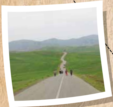
مشاهده در اردو