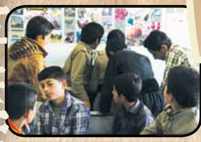
ایجاد فرصت های یادگیری