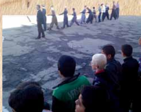
توجه به بازی‌های محلی