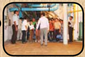
جمع آوری اطلاعات در بازدید علمی