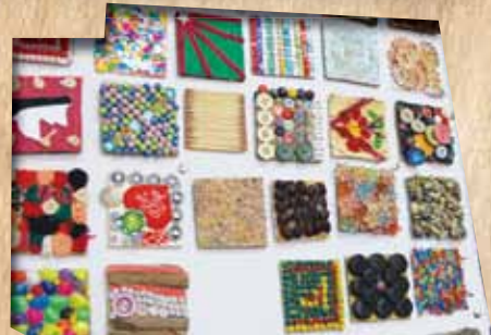
تأکید بر مهارت های بومی و دستی