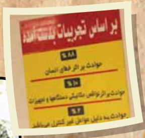
استفاده از موقعیت های یادگیری

کسی که در نیروگاه کار می کند باید خصوصیات برجسته ای داشته باشد مثلاً تن ورزیده ای داشته باشد و بتواند خوب کار کند مگر او باید بسیار قوی باشد و بتواند همسال رفاقی را احاطه کند. سودز یک سنه بتنی دو قوسی بازخامته ۷۷ متر ارتفاع ۴۰ متر عرض ۳۰۷۰۰ متر مکعب وسعت دارد. آبهای دانه عید آبی ایران در آبان ماه است نیروگاه دز ۵۲۰ مگا وات برقی تولید می کند. هنگام ساخت سد به دست آوردن انرژی الکتریکی است. آبیاری زمین های کشاورزی جلوگیری از سیل آبهای زیر نیروگاه ۸ تنواتر دارد که به ۵ خط اصلی وصل هستند.